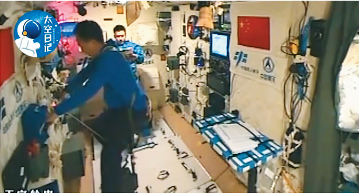
11月7日,新华社太空特约记者、航天员陈冬在天宫二号介绍航天员在太空中怎样锻炼身体,与地面健身相比有哪些不一样的感觉。这是航天员在天宫舱内锻炼。

高会增加,这对脊柱稳定性有影响。企鹅服是一种对失重状态下身体的物理防护,相当于把失去的重力加上。因为是从身体纵轴加负荷,走起路来有点像企鹅。】