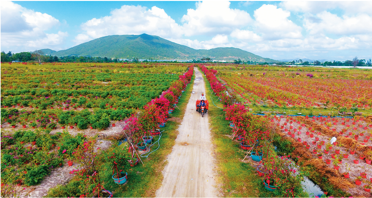
11月8日，新村镇“新村花镇”项目的三角梅等多个花种开始绽放。

该项目建成后，年可接待游客量约1000万人次，创造约1500个就业岗位，将培训出更多的专业技能型劳动力，带动更多农户增加收入、脱贫致富。