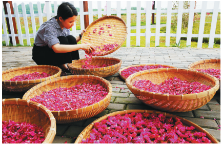
儋州爱尚玫瑰产业园成为游客喜爱的一处景点。图为园内员工在挑选晾晒玫瑰花。

由于从多方面加大投入，儋州冬季瓜菜基本稳定在21万亩，新植香芋2000亩、柚子3000亩，养殖山猪5万头、黑猪30万头，拓展桑蚕基地3600亩。儋州规模农业迅速成长起来。