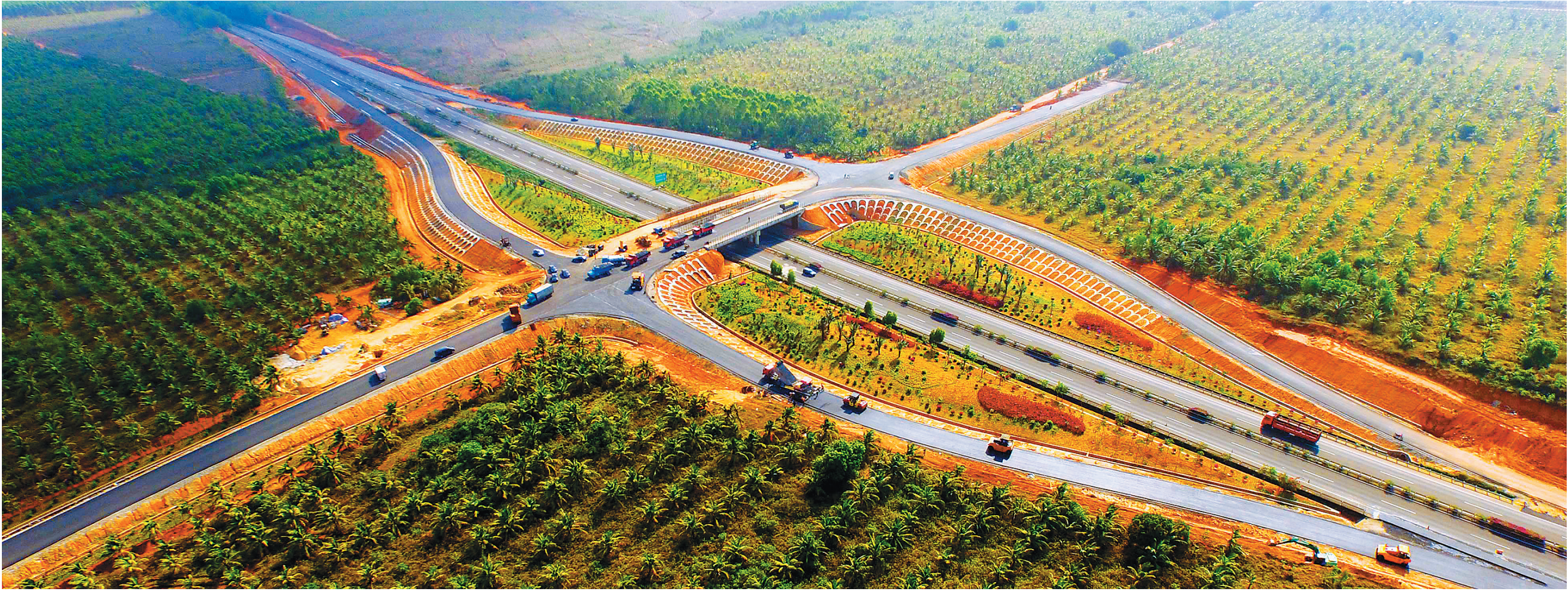
为了节省游客的旅游成本，儋州建设了东坡旅游公路。