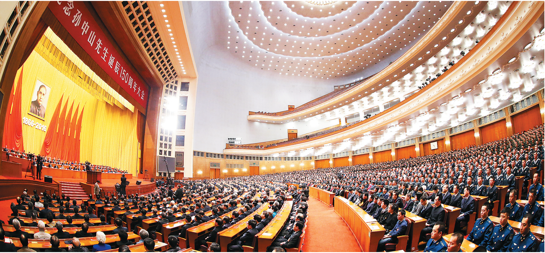
11月11日，纪念孙中山先生诞辰150周年大会在北京人民大会堂隆重举行。