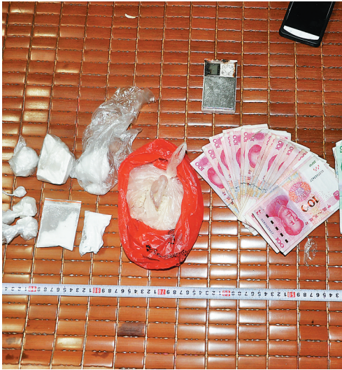
图为澄迈公安机关缴获的毒品和毒资。