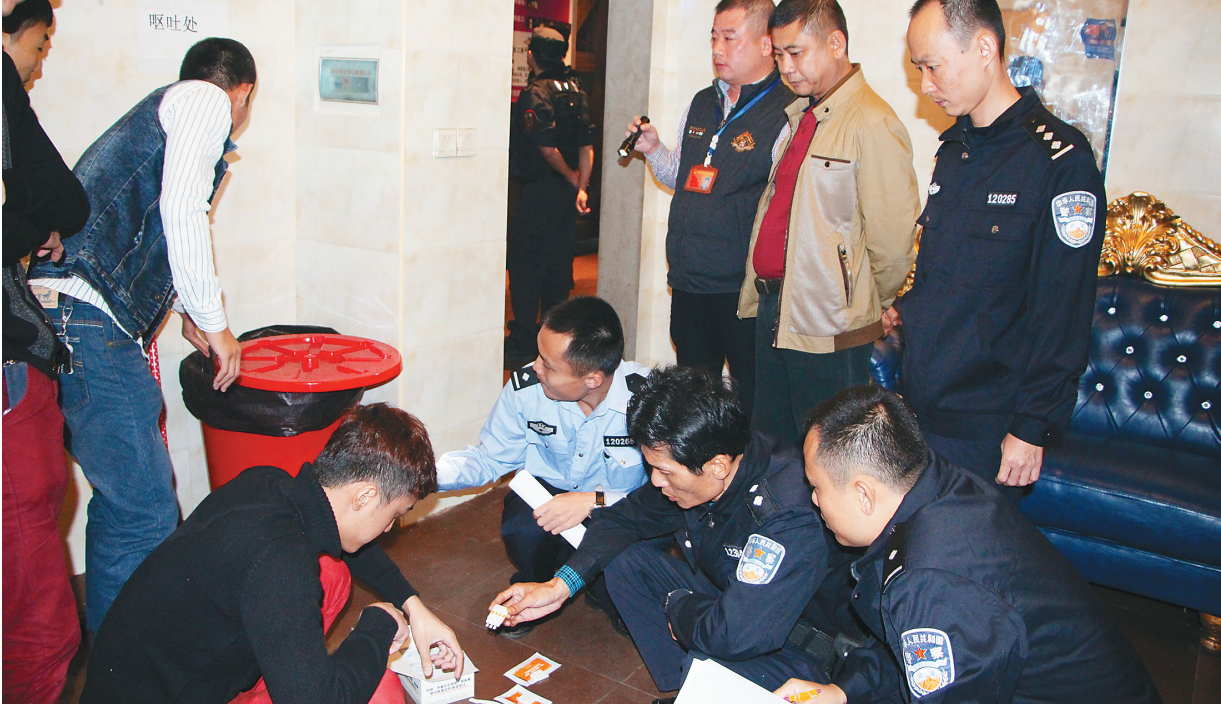
澄迈警方开展娱乐场所清查。

杨思涛要求，要严明纪律，从严问责，严格落实澄迈有关禁毒责任追究规定，及时发现整改毒品综合整治中存在的短板问题，加强对县禁毒委各成员、各镇党政主要负责人的执纪问责，确保毒品问题三年综合