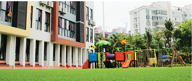
公办园太少，家长感叹入园难。