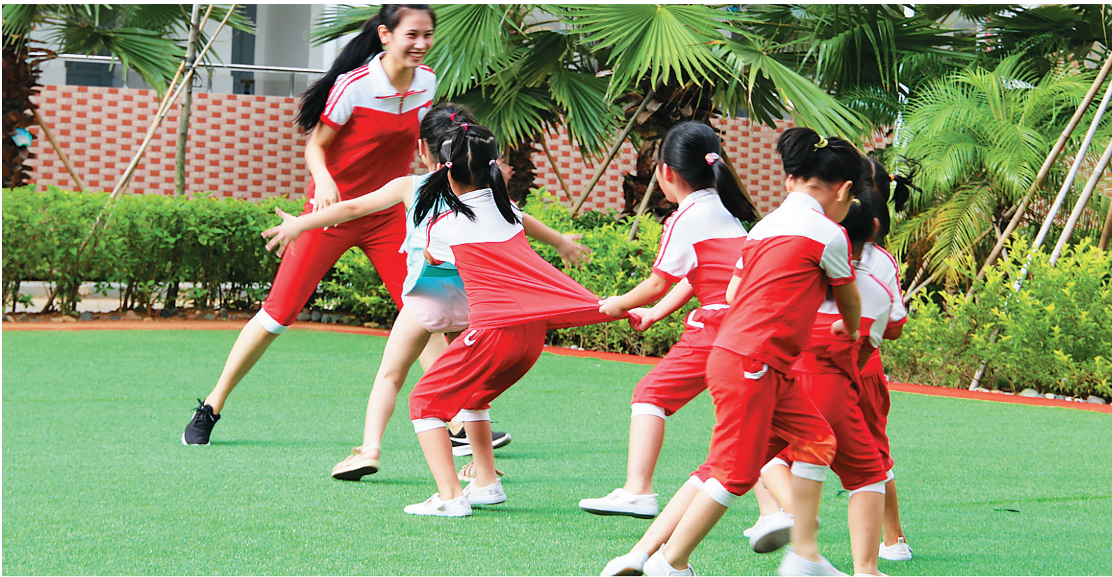
公办幼儿园无论是场地空间，还是师资力量，以及幼教理念，通常都更具优势。家长盼望能有更多的公办园满足需求。