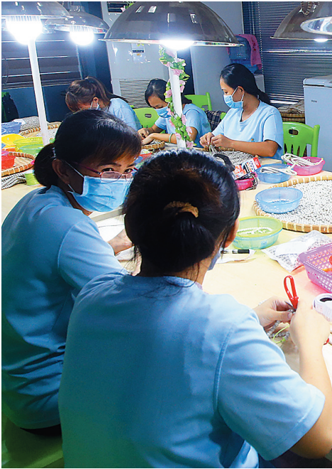
会文佛珠产业带动了当地众多贫困户就业。

海南春光食品有限公司是一家以海南椰子及热带水果为主要原料的食品加工企业，于2003年通过认定获评“海南省农业产业化重点龙头企业”，2008年获评“农业产业化国家重点龙头企业”。近年来，因公司发展需要，采取签订合同方式与当地农户联结，积极拉动椰子种植户、运销户、椰子初加工户（剥椰衣、硬壳）的发展。大力推广“公司+种植户”模式和公司报价收购方式，即公司定期购买椰苗，免费赠送农户种植，并提供技术指导支持，种植收获后再按照约定价格保价收购，今年已带动文昌89位农户脱贫致富。同时，公司还为当地一些农村闲散劳动力提供近千个就业岗位。（梦晓）