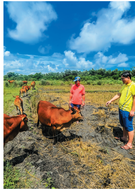
文昌市龙楼镇扶贫办工作人员下乡了解贫困户家的养牛情况。