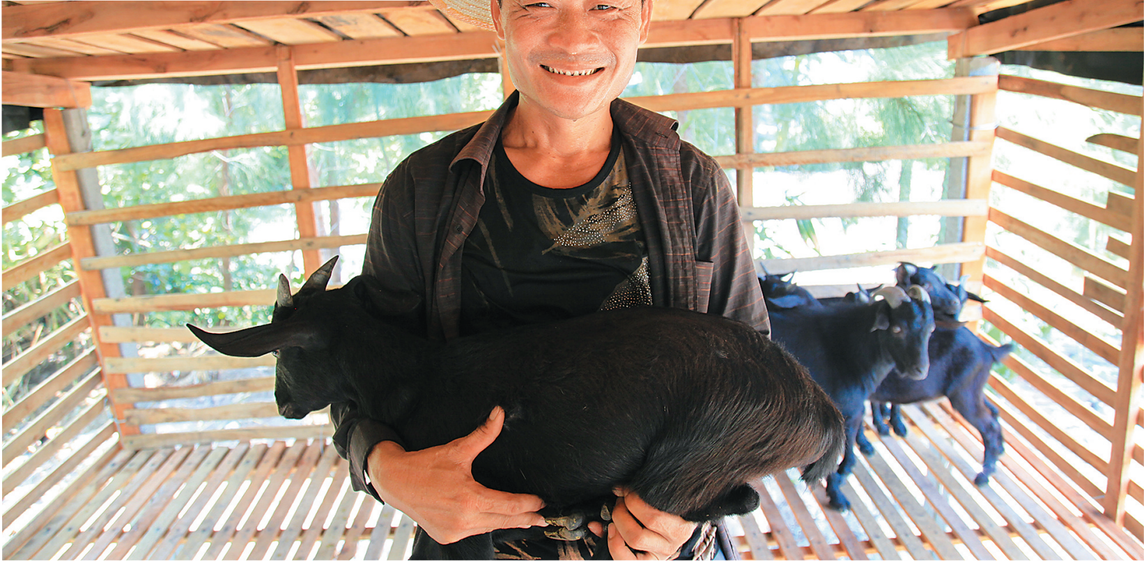
文昌相关部门为贫困户送去黑山羊，帮助他们脱贫。

今年以来，文昌市深入贯彻落实中央和省委扶贫开发工作会议精神，把“精准”贯穿到脱贫攻坚工作全过程，紧盯脱贫收入标准，按照“两不愁三保障”要求，着力实施“一户一策、一户一法”，强力推进中央“五个一批”、省“十项扶贫政策”和市“六项帮扶政策”，打出了一整套脱贫攻坚“组合拳”，精准扶贫、精准脱贫取得了阶段性成效。 在这套扶贫“组合拳”中，产业扶贫是重要支柱之一。文昌以“不离乡、不离土”的黑山羊养殖产业作为扶贫示范，以会文佛珠产业转移农村劳动力，以产业扶贫带动农民增收和贫困户脱贫，改“输血”为“造血”，打好脱贫攻坚战。