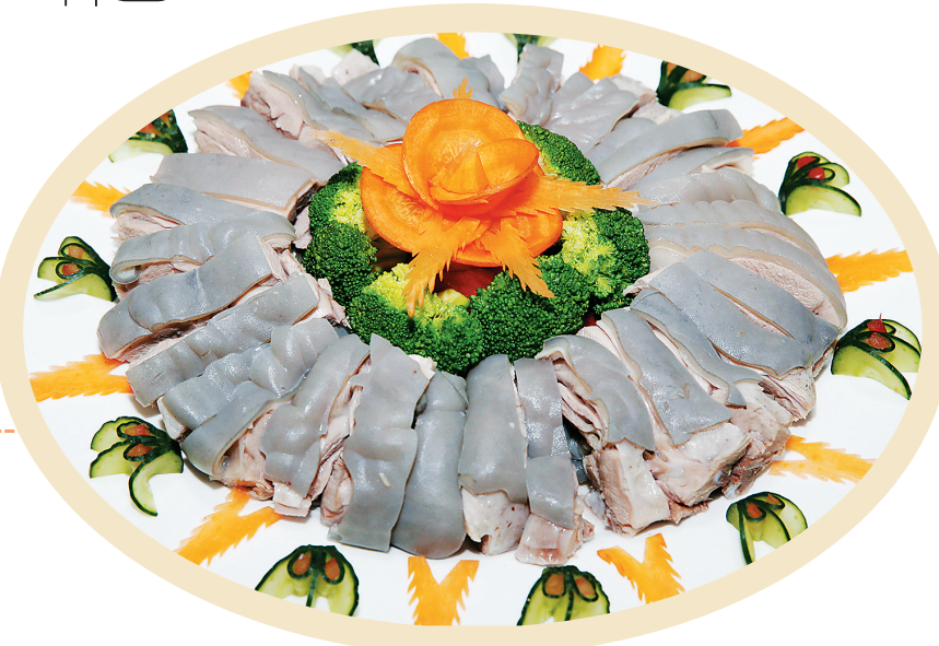
乌烈乳羊