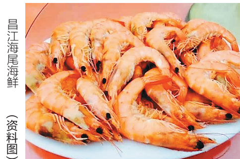
昌江海尾海鲜 (资料图)