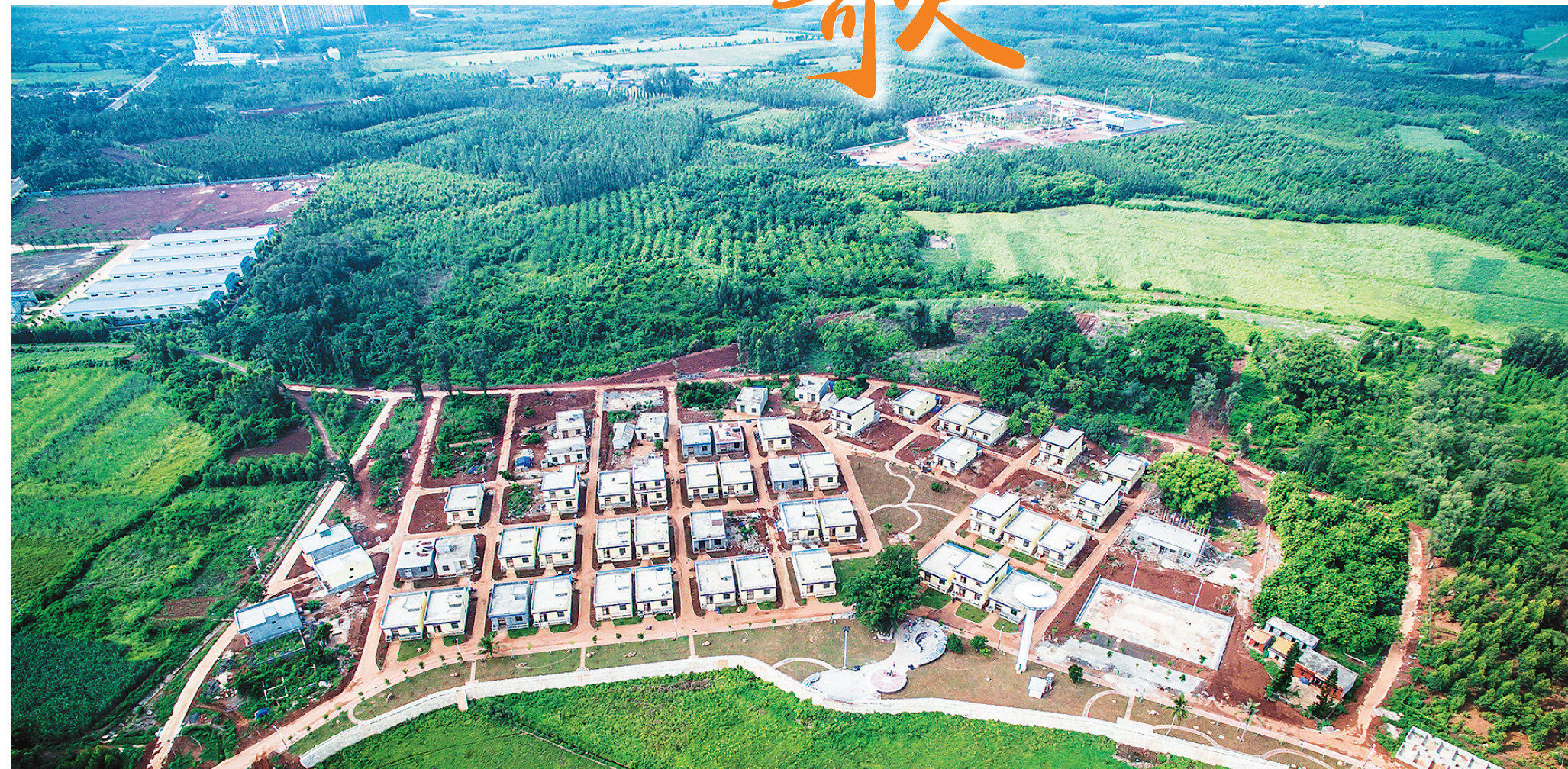
临高博厚镇道德村。

本报讯(见习记者林晓君 记者李佳飞)到三面环海的临高角，观海上日出奇景；漫步文澜文化公园，穿梭于一座座牌坊之间，接受传统文化洗礼；在美人村古树下纳凉闲谈，到美伴湖畔闲情垂钓……目前，别具一格的临高旅游珍珠链初现雏形，独特旅游资源深受游客青睐。