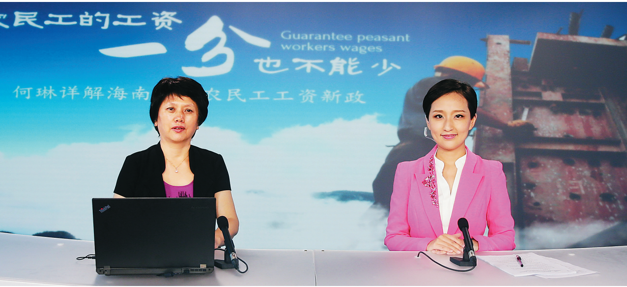
11月16日,省人社厅厅长何琳做客《公仆之声》。

“新的《实施意见》和配套文件对农民工保证金制度进行了完善”,何琳表示,新的保证金制度扩大了工程建设领域农民工工资保证金制度适用范围,从建设、交通运输、水利水电行业扩大到旅游、铁路、电力及通信基础设施建设等其他易发生拖欠工资的行业。并提高了工资保证金缴存金额,新办法规定,建设单位和施工总承包企业必须在工程开工前分别按工程中标价2.5%缴存,上不封顶。同时,建立工资保证金差异化缴存办法,对一定时期内未发生工资拖欠的企业实行减免措施。此外,还加大了对未按规定缴纳保证金行为的处罚力度,对已享受减免政策的在建项目,如出现拖欠农民工工资情况,其保证金按工程中标价的5%缴纳;且经劳动保障监察机构先予划支农民工工资保证金的企业,必须在接到划支通知书之日起30日内足额补齐保证金,否则按划支数