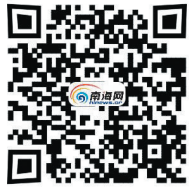
南海网视频部出品 扫码可看访谈视频