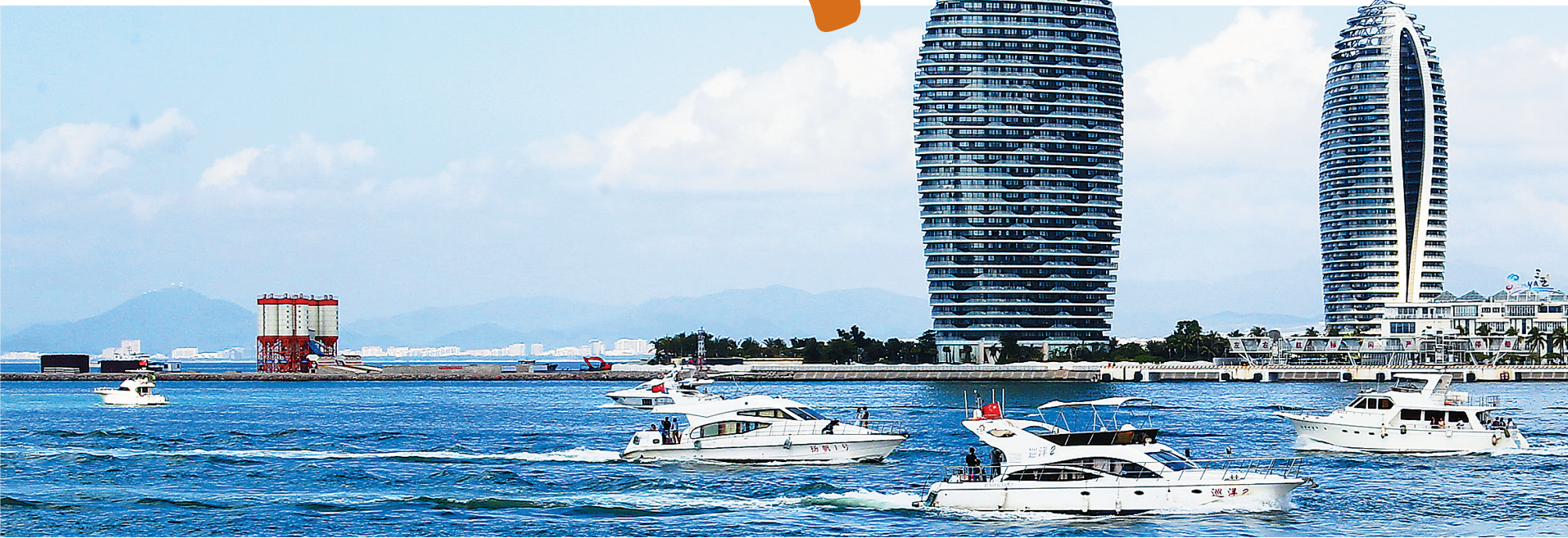
三亚迎来冬季旅游旺季。本报记者 武威 摄