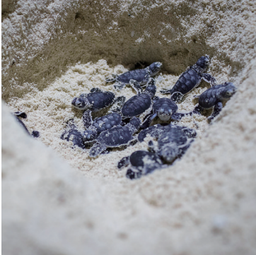
北岛沙滩上,一窝自然孵化的海龟。