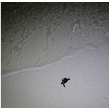
北岛海岸边,一只自然孵化的海龟开始爬向大海。