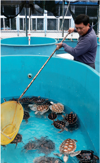
三沙市永兴岛三沙市海洋动物保护区管理局救护繁殖基地内,工作人员在清除海龟养殖池内的杂物。

入夜,位于三沙七连屿的北岛一片漆黑,靠着几盏渔灯和手电筒的光亮,47岁的渔民陈山开始一天中最重要的工作。他沿着数百米的沙滩巡逻,时刻望向大海的方向。 从6月开始,陈山一直守着海龟上岸产卵,然后在那些巢穴处插上保护牌,如果发现哪里海龟产卵的位置低了,他会用手刨开海沙,把海龟蛋带回保护站进行人工孵化。 海龟是大型海洋爬行动物,被称作“海洋旗舰物种”。2012年三沙设市后,开展了一系列保护工作,为海龟营造一个温暖的家,让这些海洋精灵在西沙群岛繁衍生息。