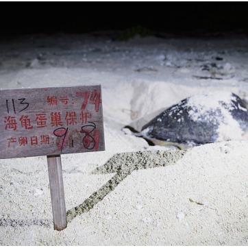
今年开始,北岛上的渔民制作了记录牌,保护海龟蛋巢。

史海涛长期关注南海海龟状况,他表示,在我国,海龟产卵喜欢热带地区,需要合适的温度,同时也需要好的沙滩,西沙群岛具备这样的条件,是最理想的海龟产卵地。 史海涛表示,海龟是无国界物种,长年在海里长距离洄游。它的一个特性就是在20岁至30岁性成熟后,会返回出生地产卵。 1989年1月14日,原林业部、农业部发布施行《国家重点保护野生动物名录》,将海龟列为国家二级保护动物。从那时起,海龟的保护问题愈发受重视。