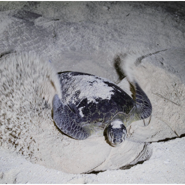
三沙市七连屿北岛,一只上岸产卵的海龟正在用沙子覆盖蛋巢。