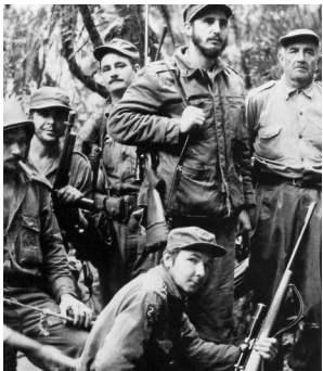
菲德尔·卡斯特罗(前)、菲德尔·卡斯特罗(右二)和切·格瓦拉(左二)等1958年开展游击战争时拍摄的照片。