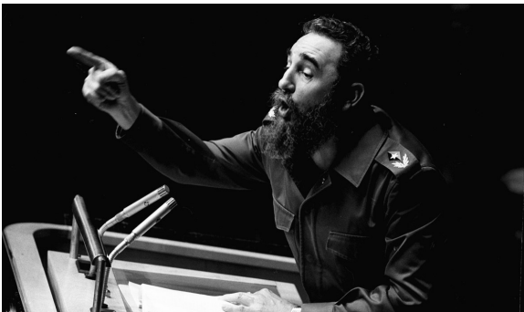
1979年10月12日在美国纽约拍摄的菲德尔·卡斯特罗的资料照片。