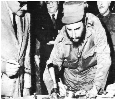
1959年2月16日,菲德尔·卡斯特罗在哈瓦那就任政府总理时在职文件上签字的资料照片。