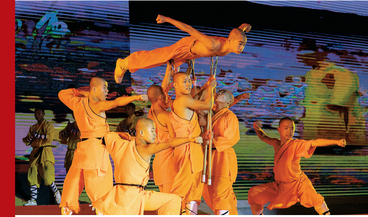
音乐会永庆寺武僧团表演武术。