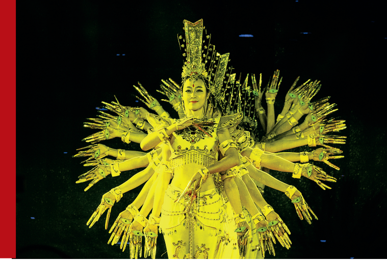
音乐会上的《千手观音》表演。