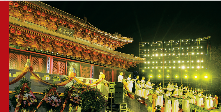
11月27日晚，南海佛教与海上丝绸之路梵呗音乐会在永庆寺举行。

观音阁建成后，将与陕西大香山寺相互联动，形成“山海互动”，同时与海南南部三亞海上观音遥相呼应，形成“南北呼应”，将成为澄迈盈滨半岛旅游度假区项目乃至琼北地区佛教文化的标志性建筑，有利于迅速形成琼北“大旅游产业”发展氛围，将大大带动琼北地区乃至全省旅游产业发展，对打造海南全域旅游，建设海南国际旅游岛都具有重要的意义。