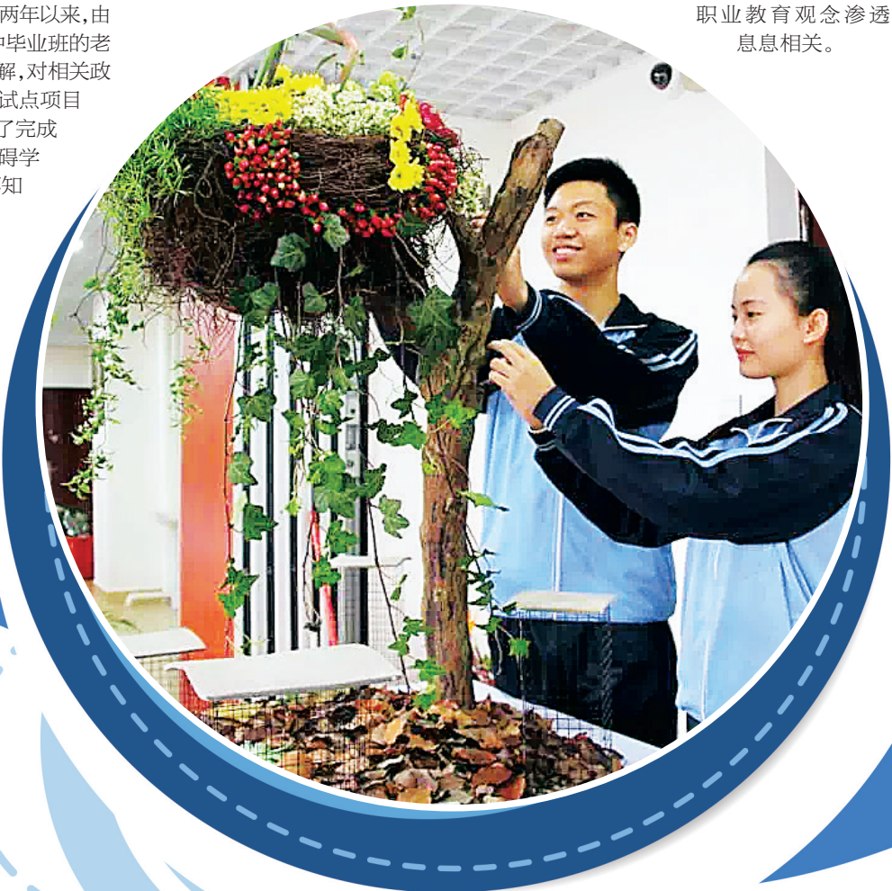
省农校3+4“试点项目园艺专业学生在学习相关技术。

省教育厅职业教育与成人教育处副处长张清明说,在德国,小学生每学期必须去职校体验一周,初中生每学期必须去实习一个月,德国工匠精神举世闻名,与他们重视职业教育观念渗透息息相关。