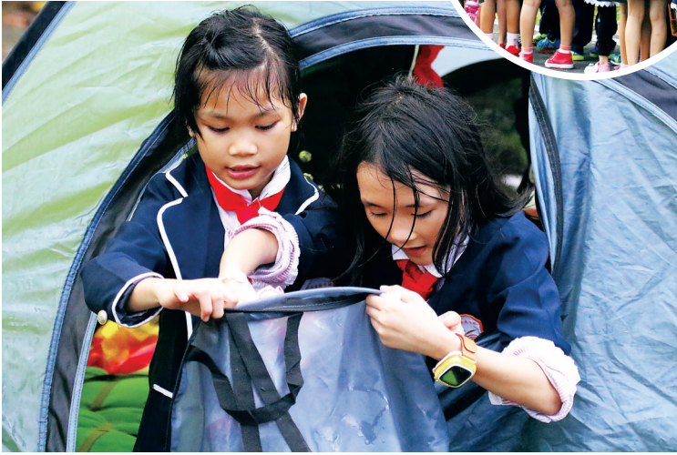
睡帐篷,好兴奋。

根据本次课堂设计,为孩子们定的毅行目标为8公里,需要背上装有帐篷、被子等将近5公斤的行囊前行,分别在兴隆国家绿道与兴隆热带花园展开,其中占地5800亩的热带花园,具有丰富的热带雨林资源,拥有超过4000余种热带植物,向孩子们铺开一幅生机勃勃的大自然图景。