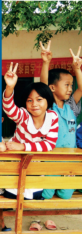
保亭加茂镇界水小学二年级学生。

今年上半年,也是因为“送教下乡”项目,在保亭加茂镇的教学点——界水小学,一群活泼可爱的孩子走进我的镜头里。