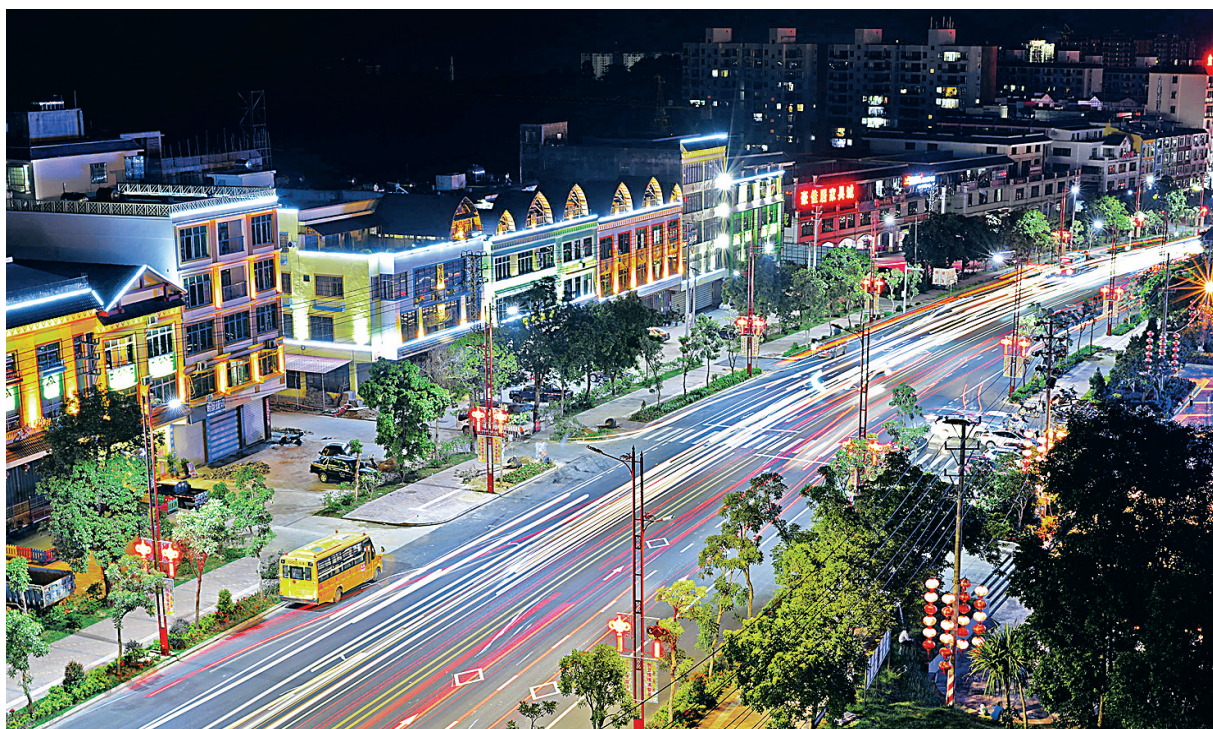
琼中县城夜景。