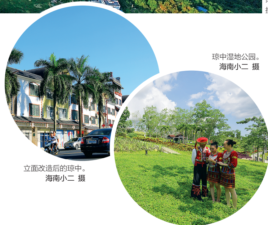
立面改造后的琼中。

省建设项目规划设计研究院高级规划师高江华肯定了琼中规划局提出的“慢生活”休闲旅游之路。他说，琼中拥有得天独厚的资源环境和特色的人文环境，能够充分利用本地的森林、水系、植被、花卉、南药等生态优势，结合独特的民族文化、特色产业文化、红色文化以及运动体育文化等人文环境，对拉动琼中旅游发展起着最直接关键的作用，也可提高居民收入，给游客带来最好的体验之旅。