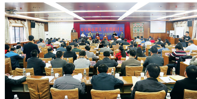
研讨会现场。