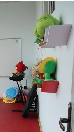
海南国兴中学心理咨询室一角。