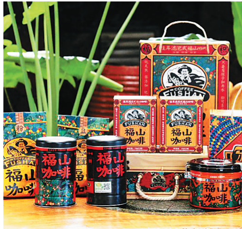
福山咖啡系列产品。