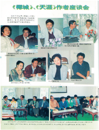
1995年第3期封面内页上关于座谈会的照片留念。