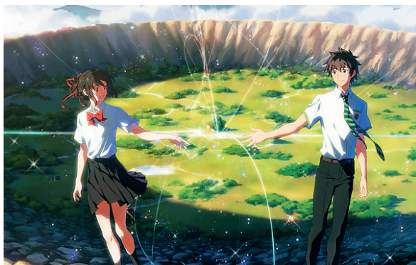
新海诚的作品画风唯美，因此被网友戏称为“壁纸诚”。