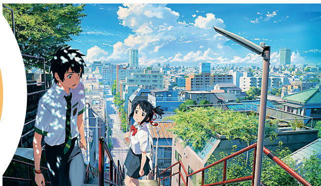
《你的名字》，今年日本本土电影的年度票房冠军。