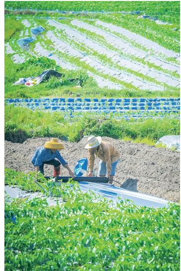
琼海农民在辣椒地里铺设地膜。

参展企业有:琼海发宝养殖有限公司、琼海海星酒店有限公司、琼海椰光实业有限公司、琼海恒萃油茶农民专业合作社、琼海福松实业有限公司、琼海鹏业红龙果农民专业合作社、琼海多果莲雾种植专业合作社、琼海忠锐农业开发有限公司、海南品香园食品有限公司等。