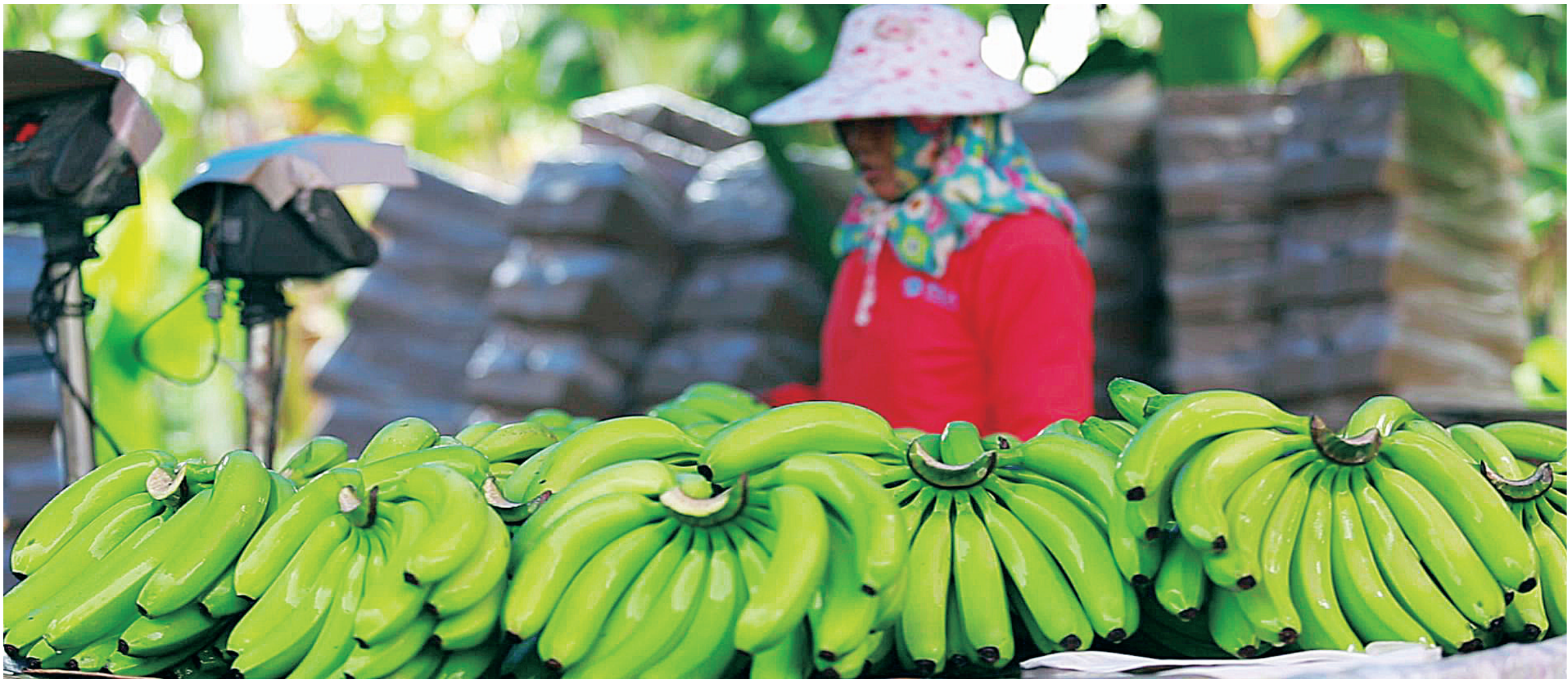
临高大力发展热带高效特色农业品牌,农业增效,农民持续增收。