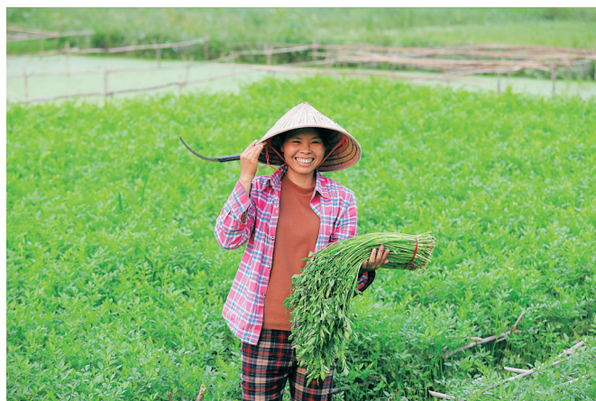
临高水芹深受市场欢迎。