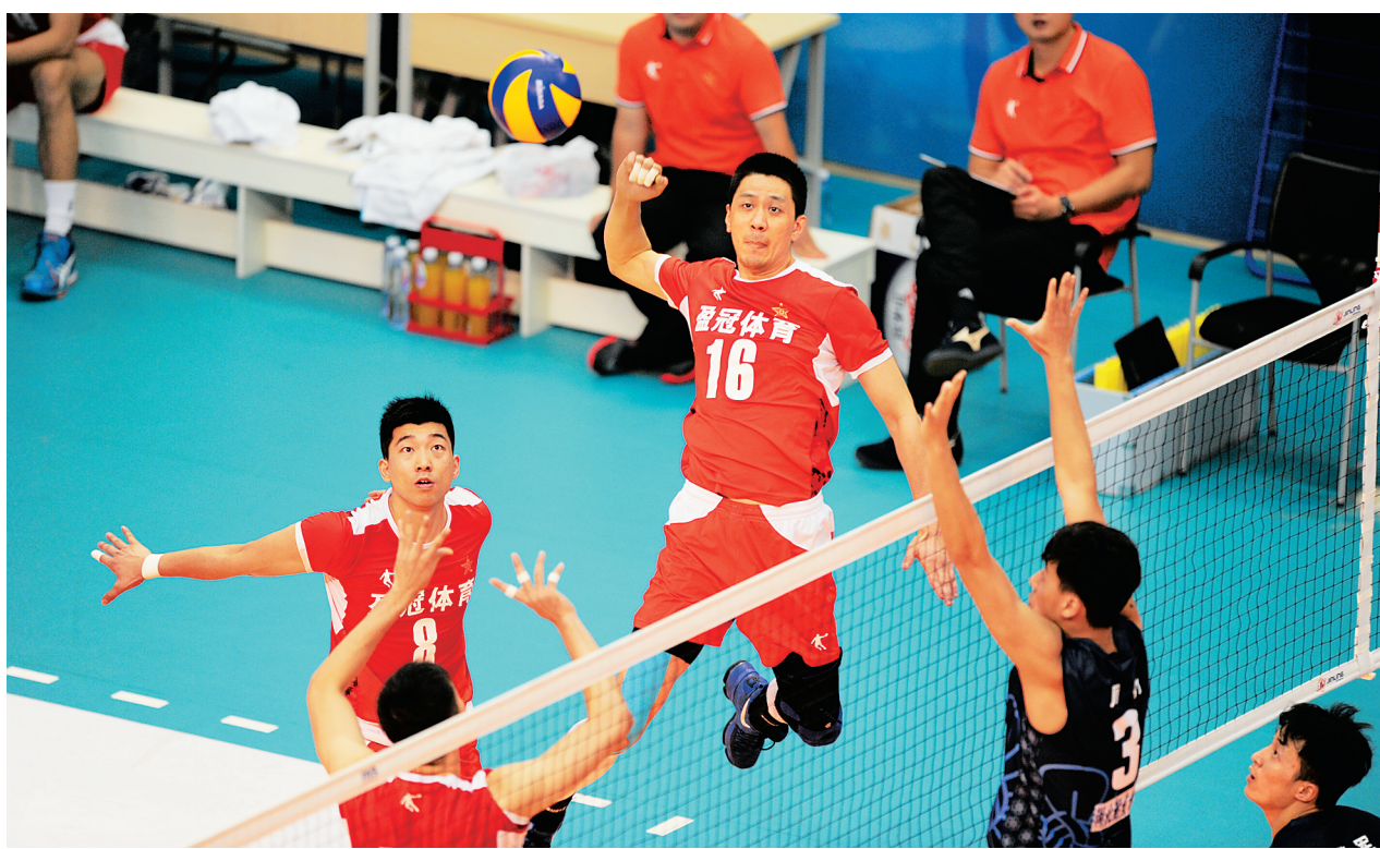
八一男排队员在扣球。