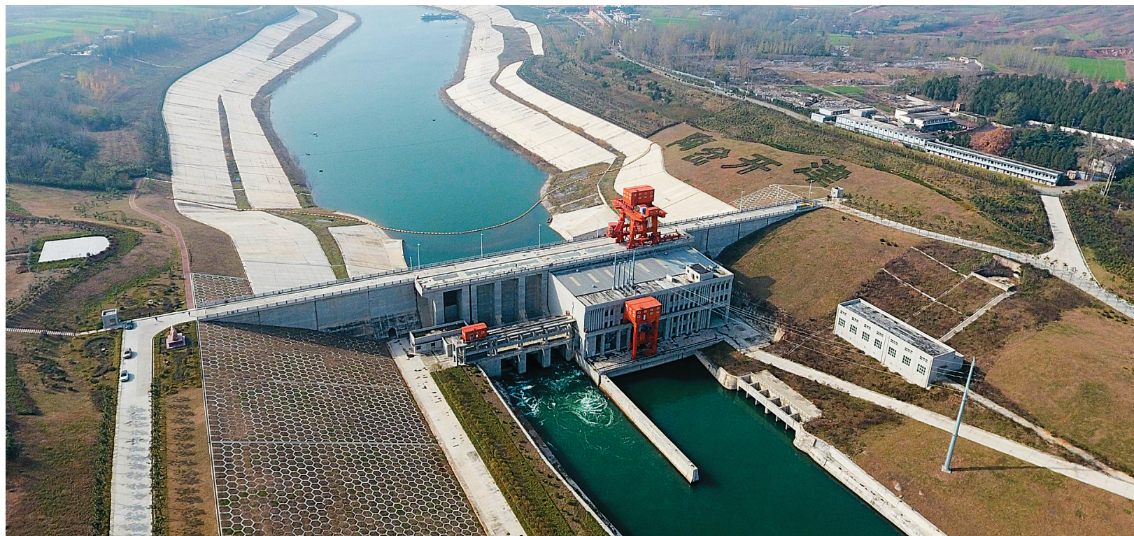
这是南水北调中线一期工程河南淅川陶岔渠首枢纽工程。北京、天津等受水区6省市加快了南水北调水对当地地下水水源的置换,已压减地下水开采量2.78亿立方米。北京市、河南省许昌市城区以及山东省平原地区等超采区的地下水位已经开始回升。