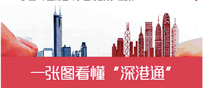
一张图看懂“深港通”

经过一年多的“等待”，12月5日深港通正式开通，整个市场拍手叫好者有之，冷眼旁观者有之。海南银行业内人士表示，深港通开放标的范围超预期，总额度取消意义重大，税收优惠政策有望提升深港通成交热度。对于海南资本市场而言，有机遇也有挑战。从长期来看，海外投资者将成为未来A股投资者结构的重要组成部分，整个市场的特征可能会逐步向成熟市场演进，A股的估值体系也将逐步由“中国特色”向“全球接轨”切换。