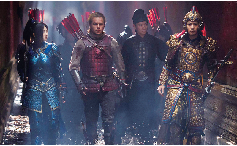
张艺谋导演的电影《长城》剧照