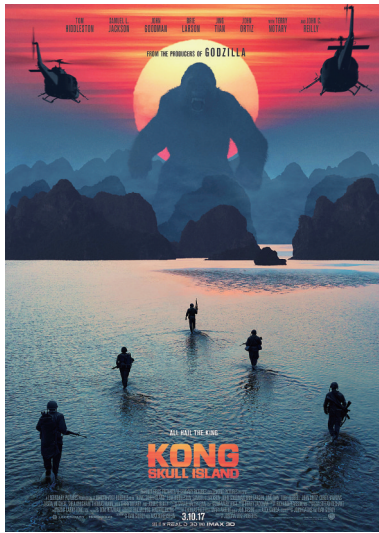
《金刚：骷髅岛》英文海报

记者了解到，11年前的2005年圣诞档期，彼得·杰克逊执导的《金刚》引进我国上映后迅速攻占票房，在当年全国总票房还只有20.46亿元的时代，《金刚》的全国总票房就达到了1.023亿元，占全年的二十分之一，可谓真正的爆款片。对于《金刚：骷髅岛》能否再掀票房热潮，该人士却表现得比较谨慎：“今年票房下滑大家都看到了，所以预测成绩很难。不过，既然传奇影业接盘来开发《金刚》系列片，而且被万达收购了，应该会卖座。毕竟，好莱坞电影工业的原则就是——什么赚钱拍什么！”