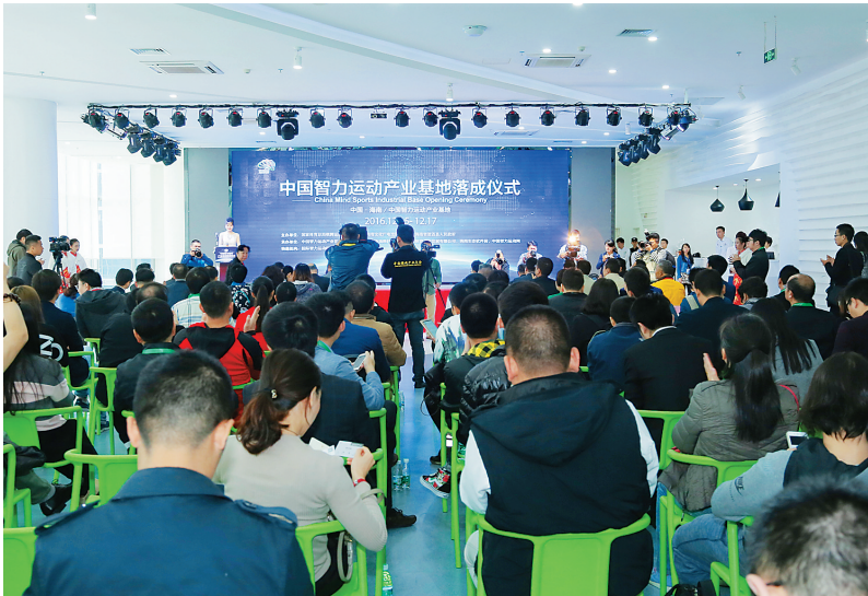
中国智力运动产业基地落成仪式。