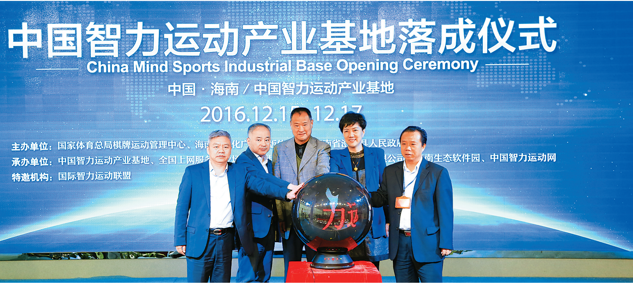
中国智力运动产业基地落成仪式。