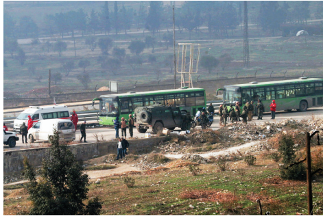
12月16日，在叙利亚阿勒颇，用于人员撤离的巴士在撤离进程中中止后驶离。

自今年9月以来，叙政府军步步推进，把阿勒颇东部的反政府武装包围在一个南北走向的狭长地带内，并于11月下旬加大军事打击力度，在短时间内取得重大进展。叙军方消息人士12月13日告诉新华社记者，阿勒颇的反政府武装分子已被围困在该市东南部约2平方公里的区域内。