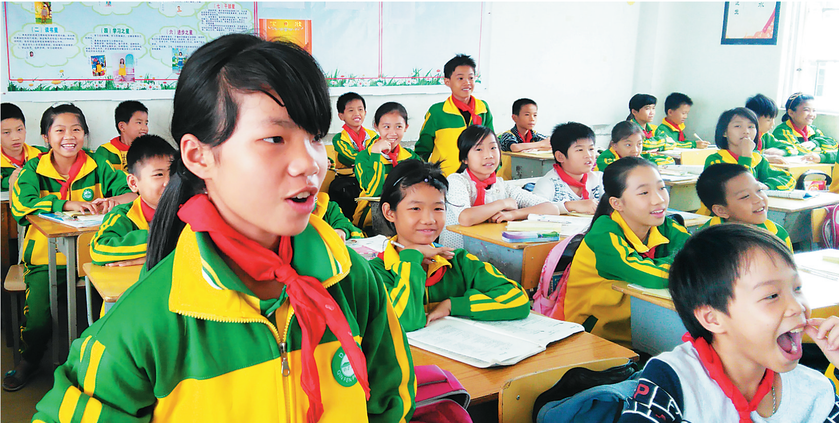
组织学生评析作文，“小老师”们发言踊跃。

道地分析着：“我喜欢第二篇文章。他在写到段考中的心理活动很形象，很真实，我也有这样的感受。比如写到‘我惊奇地发现试卷上的好多题都是老师平时提醒我们注意的，我心花怒放’，我读出了作者内心的兴奋。而且文章着重写的是段考过程中的事，重点很突出。”