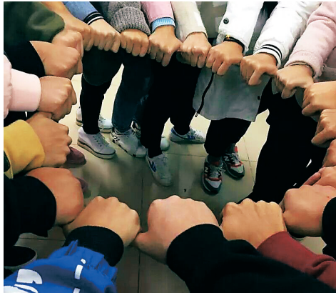
团体辅导课，加深了同学之间的友情。