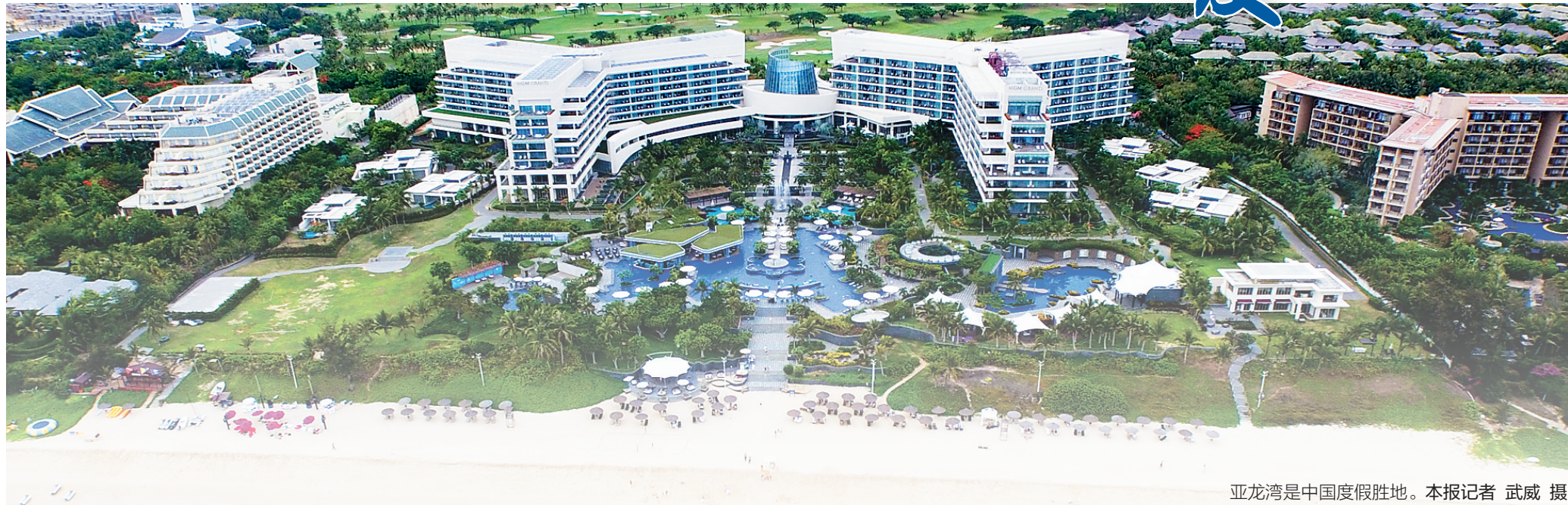
亚龙湾是中国度假胜地。