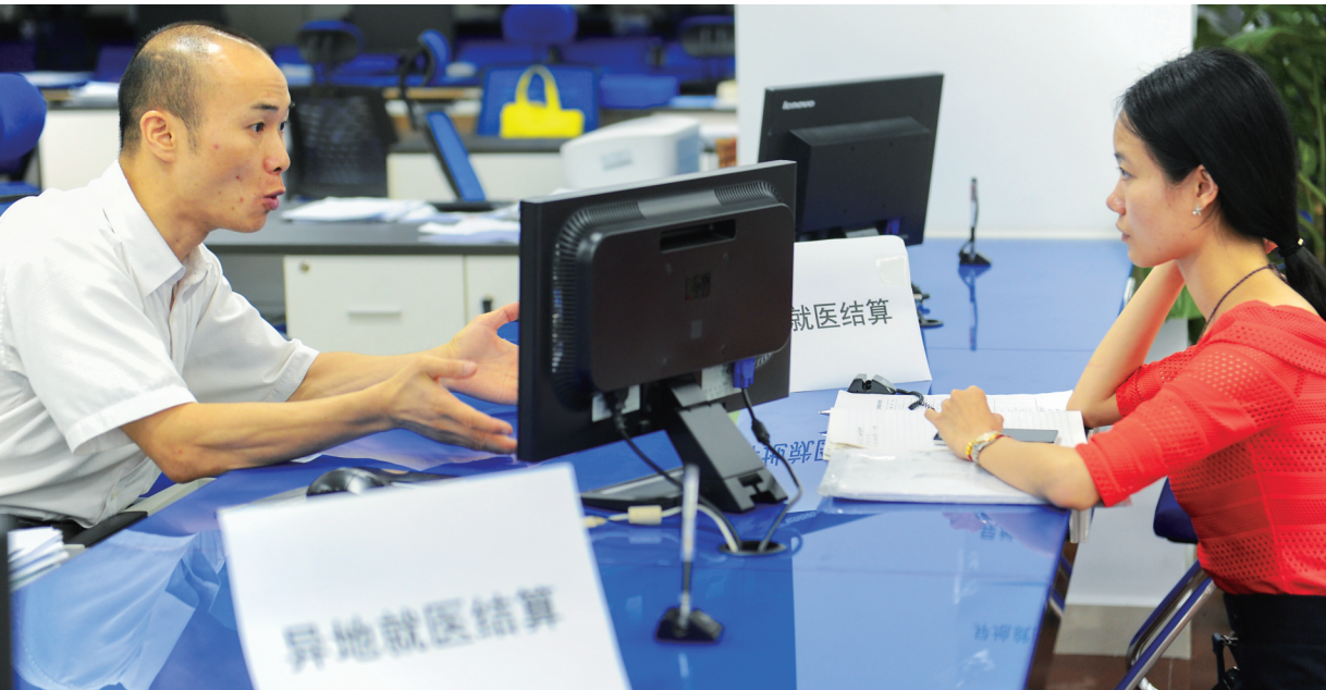
海南省社保局的工作人员（图左）正在为参保人解释异地就医结算相关事宜。

据统计，截至今年5月，我省异地就医结算服务量从2010年的41人次增至46728人次，发生医疗费用总额1.59亿元，统筹支付1.12亿元。