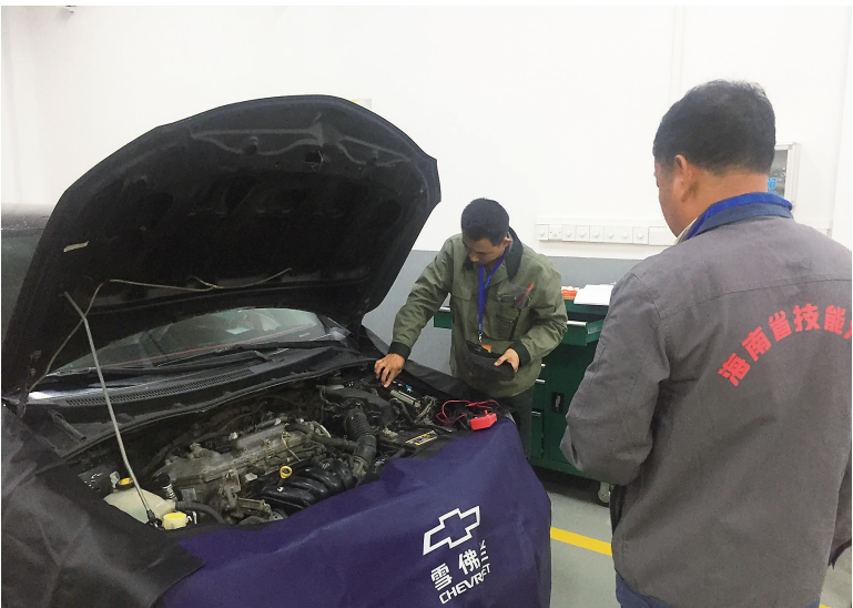
汽车维修项目决赛现场。

等奖16名，优秀组织奖5名。 省人力资源开发局副局长周法圳表示，随着时代发展，家政服务工作的技术含量越来越高，对从业人员的技能水平提出了更高的要求，家政行业在国际旅游岛建设中，特别是服务“候鸟”人才中将起到越来越重要的作用；汽修行业在塑造工匠精神，打造“中国制造2025”进程中，将起到重要的作用。通过比赛，很好地展示了海南省家政服务行业和汽车维修人员形象及从业人员风采。希望我省家政行业、汽修行业从业人员以大赛为契机，立足本职工作，热爱本职工作，刻苦钻研，积极提高技能，提高工作的积极性和创造性，提供更加优质、高效的服务。 本次活动由省人社厅、共青团海南省委、省妇联联合主办，省就业局承办。 （洪宝光）