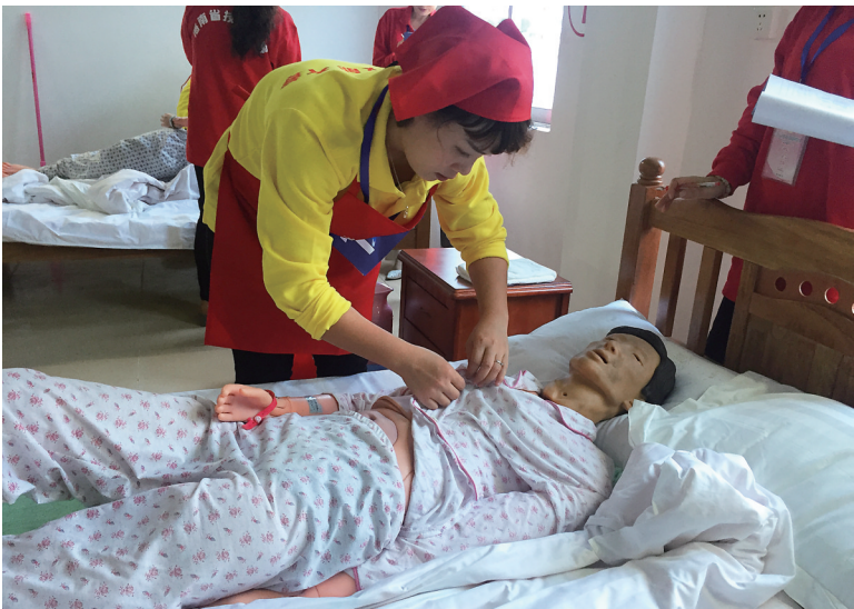
家政服务项目决赛现场。