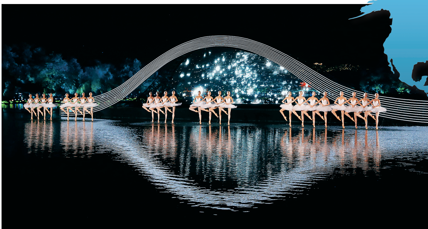
9月4日，演员在表演《天鹅湖》。当日，出席二十国集团领导人杭州峰会的G20成员和嘉宾国领导人及有关国际组织负责人在杭州西湖景区观看《最忆是杭州》实景演出交响音乐会。

↑9月5日，在英国首都伦敦议会大楼外，“脱欧”支持者于举标语呼吁启动《里斯本条约》第50条，正式开始“脱欧”程序。 新华社社论