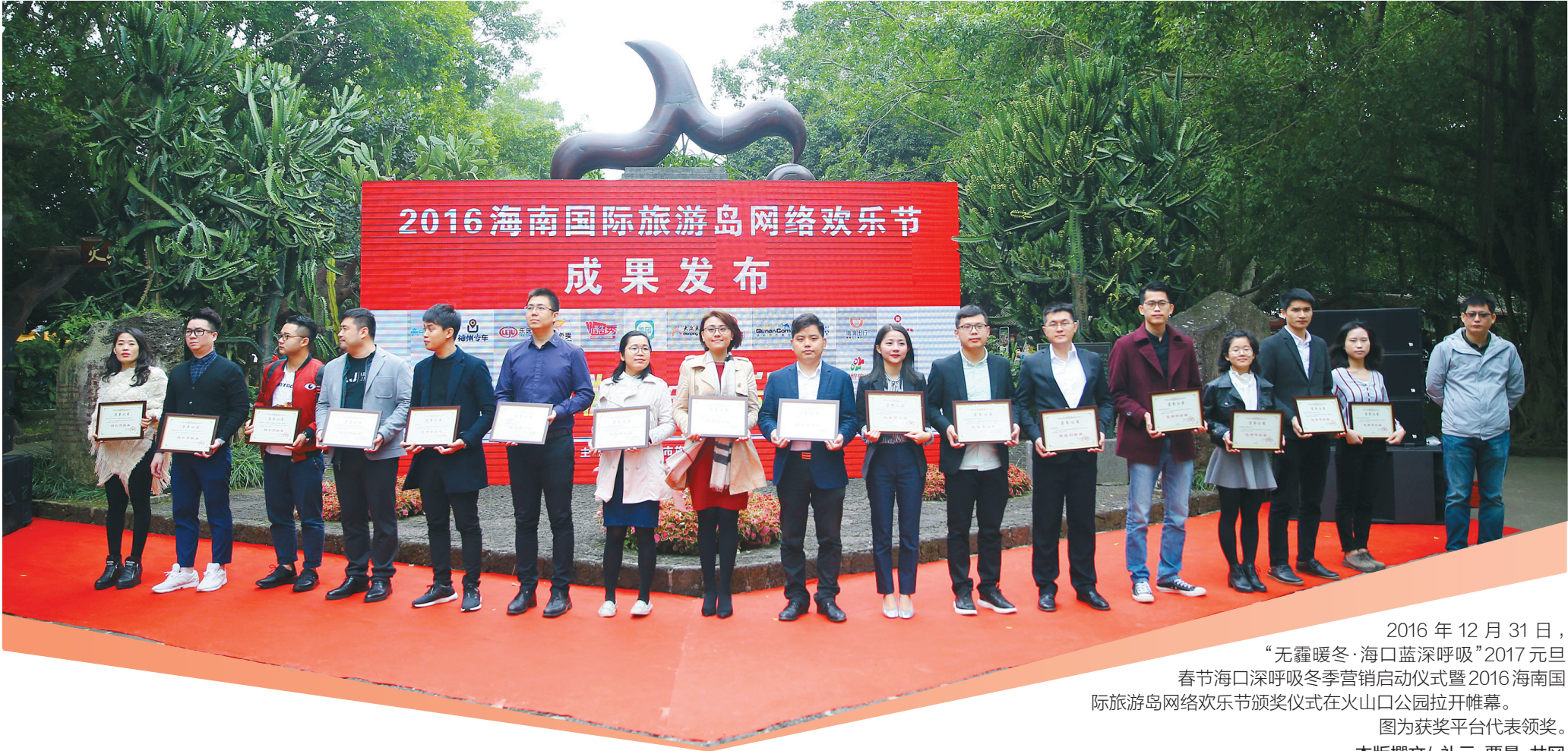
2016年12月31日,“无霾暖冬·海口蓝深呼吸”2017元旦春节海口深呼吸冬季营销启动仪式暨2016海南国际旅游岛网络欢乐节颁奖仪式在火山口公园拉开帷幕。图为获奖平台代表领奖。本版撰文/礼元 覃曼 井冈