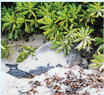
在三沙北岛,一只绿海龟在产卵。