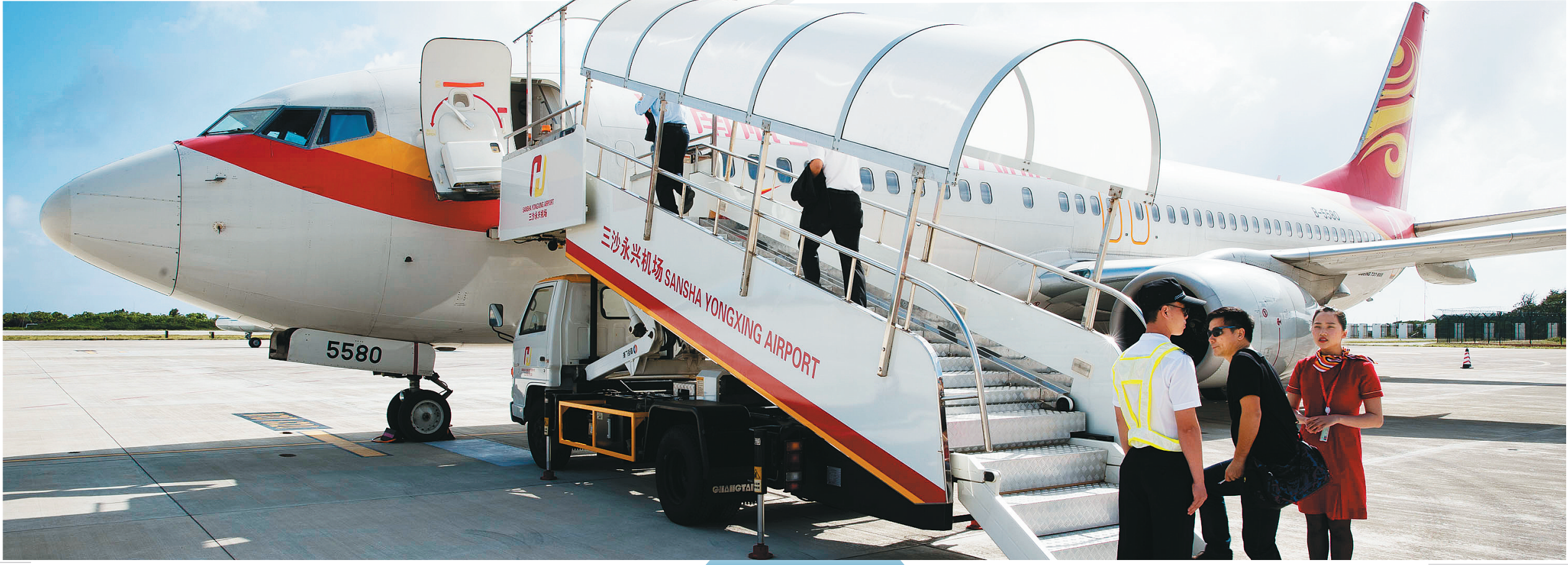
二〇一六年十二月二十日,三沙市永兴机场民航公务包机航班成功首航。