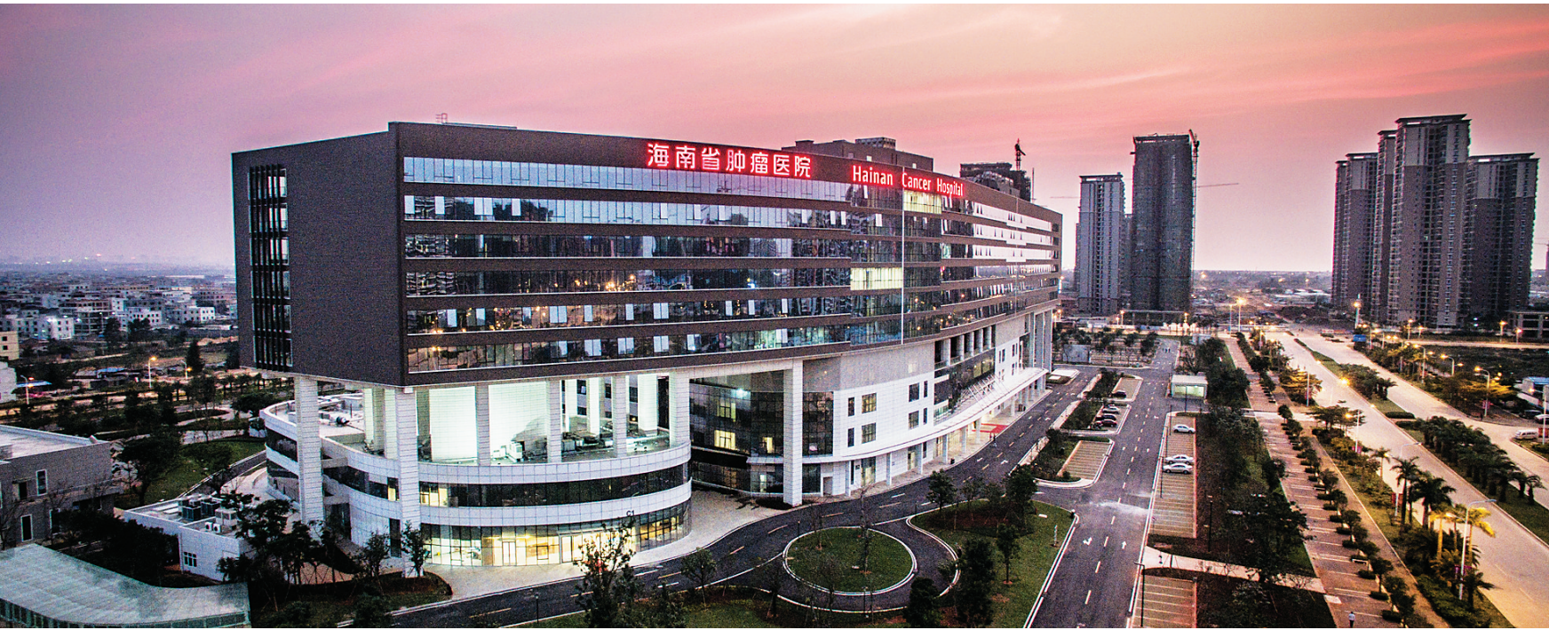
海南省肿瘤医院。

注：1.“监督曝光台”2015年7月1日至2017年12月31日每周一在《海南日报》定期刊登。 2.连续两次未按要求上报相关数据的，将予以通报批评。 海南省整治违法建筑三年攻坚行动领导小组办公室发布 2017年1月1日