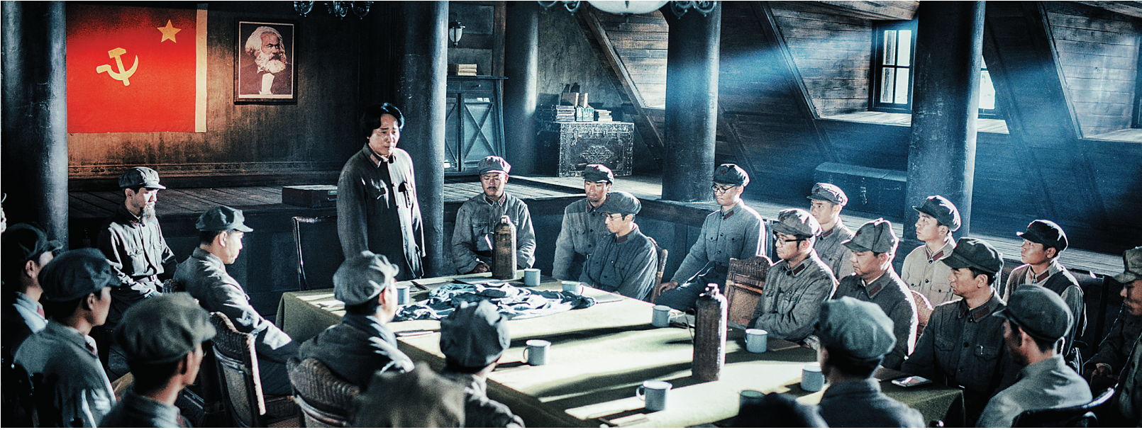
长征题材影片《血战湘江》剧照

红军34师7000多名官兵大多是闽西子弟,不少是客家人。第二天,八一厂又带着影片来到长汀县客家剧院,700多人的剧场座无虚席,有拄着拐杖