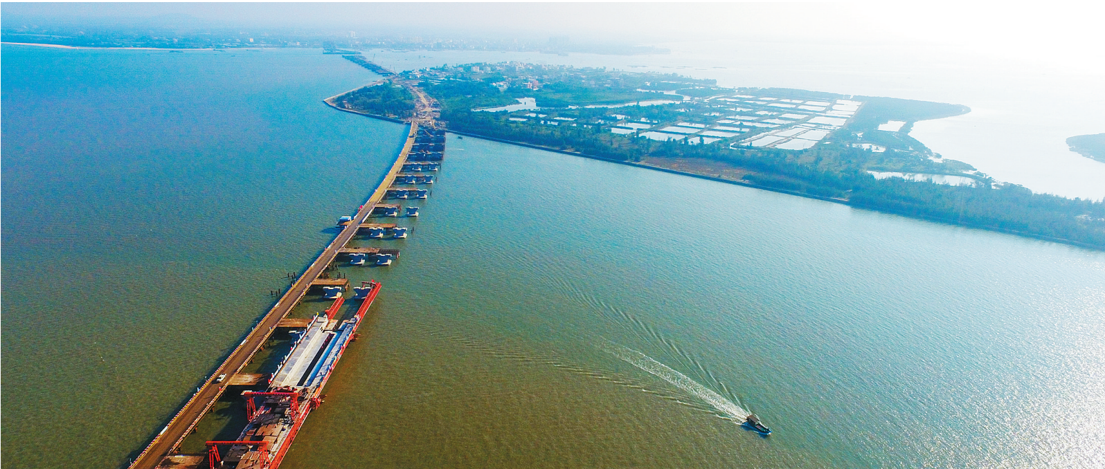
1月3日,连接海口与文昌的铺前大桥项目稳步推进。截至2016年底,铺前大桥已累计完成投资12.6亿余元,完成总投资的42%。

我省始终将抓投资、上项目作为经济工作的重点,服务社会投资百日大行动期间,在“五网”基础设施、十二个重点产业、民生保障等重点领域,我省一大批重特大项目捷报频传:桂林洋国家热带农业公园、乐东