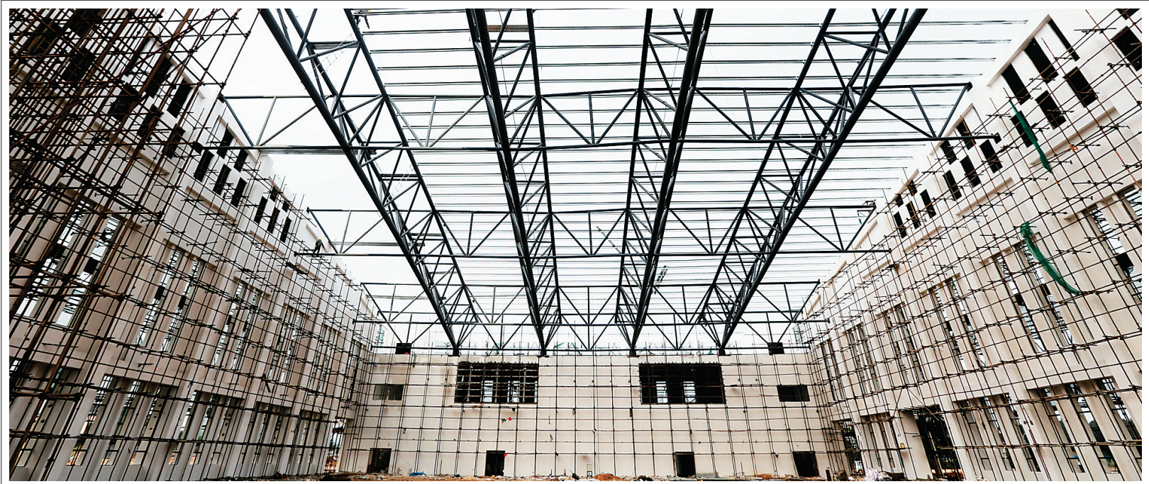
临高全民健身活动中心 今年3月竣工

日前，临高县全民健身活动中心进入焊接安装钢结构屋顶的施工阶段。临高县全民健身活动中心于2016年5月开工建设，场馆规划建筑面积7612平方米，项目资金3500万元，占地面积80亩，主要建设运动场、体育馆、篮球场、门球场等。目前项目已完成总工程量的80%，预计2017年3月下旬竣工投入使用。