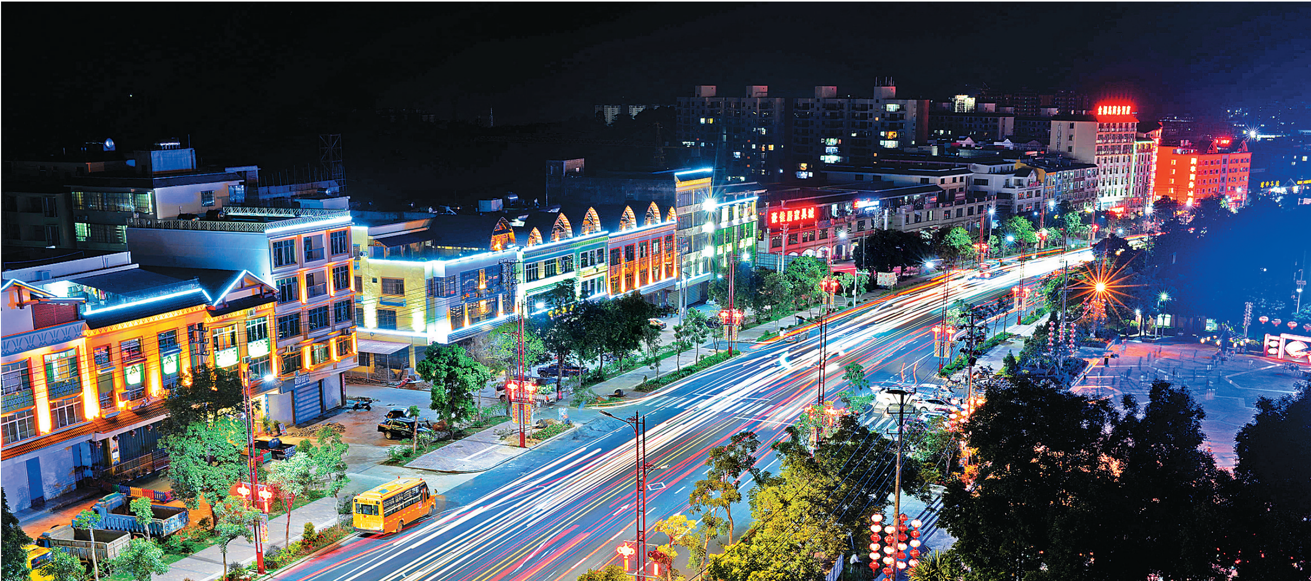
梦幻般的琼中夜景。