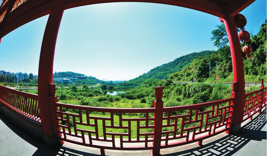
百花廊桥美如画。