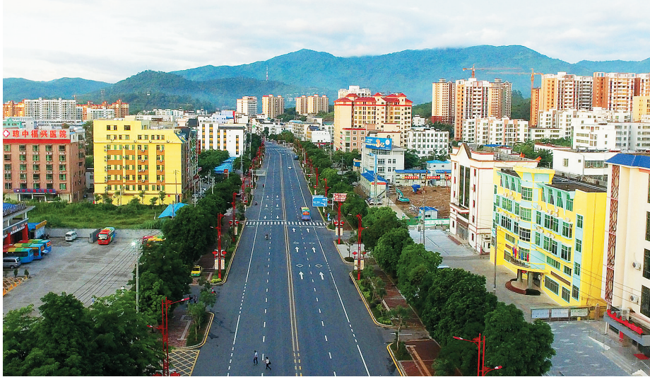
功能提升和立面改造后的海榆大道。