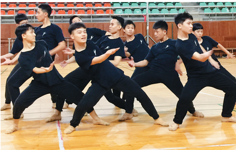
男子舞蹈班在表演群舞《红色英雄》

高难度的技巧展示以及在群舞中的超高难度动作发挥,激发出现场数百位家长和老师们阵阵激情掌声。海中舞蹈团相关负责人告诉记者,该团2016年3月份参加了博鳌亚洲论坛十五周年庆典晚会演出,4月份赴青岛参加了全国第五届中国小学生艺术展演,并获得了中国舞蹈家协会授予的“中小学舞蹈教育传统校”荣誉称号,5月份参加了澳门教育中学学生来访交流演出,9月份参加了学校迎新暨庆祝第三十二届教师节文艺晚会,11月份参加了“足球新长征”海南站启动仪式演出,在多项大型活动中多次登台亮相,让这些习舞孩子既展示了海南中学的形象,也收获了青春成长的硕果。