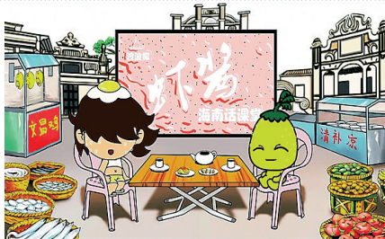
波波椰虾酱海南语课堂视频截图

链合作基地负责人方晓达表示，动漫形象的变现方式多种多样，常见的就有拍摄电影、制作漫画、售卖IP使用权等，但对于基础较为薄弱，产业链还不够完善的海南动漫产业而言，各企业和团队在抢占高地后，应保持足够耐心，不要在盈利上操之过急，“依余光中先生所说：‘天下的一切都是忙出来的，惟独文化是闲出来的。’相信在海南‘慢文化’的滋养下，未来一定能够沉淀和涌现出更多富有新意和特色的本土IP。”