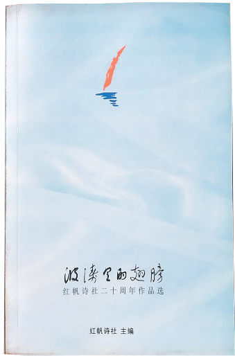
红帆诗社20周年纪念诗集

“大家都在争着比谁写得更好、谁发表作品更多,时不时还能邀请到韩少功、李少君、冯麟煌、陈剑辉、远岸等知名诗人、作家来校讲座和指导,干劲可足了!”为了把大家的作品传播开去,他还做了一件令人颇为叹服