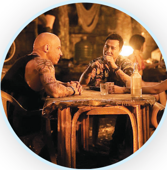
甄子丹(右)在《极限特工》中