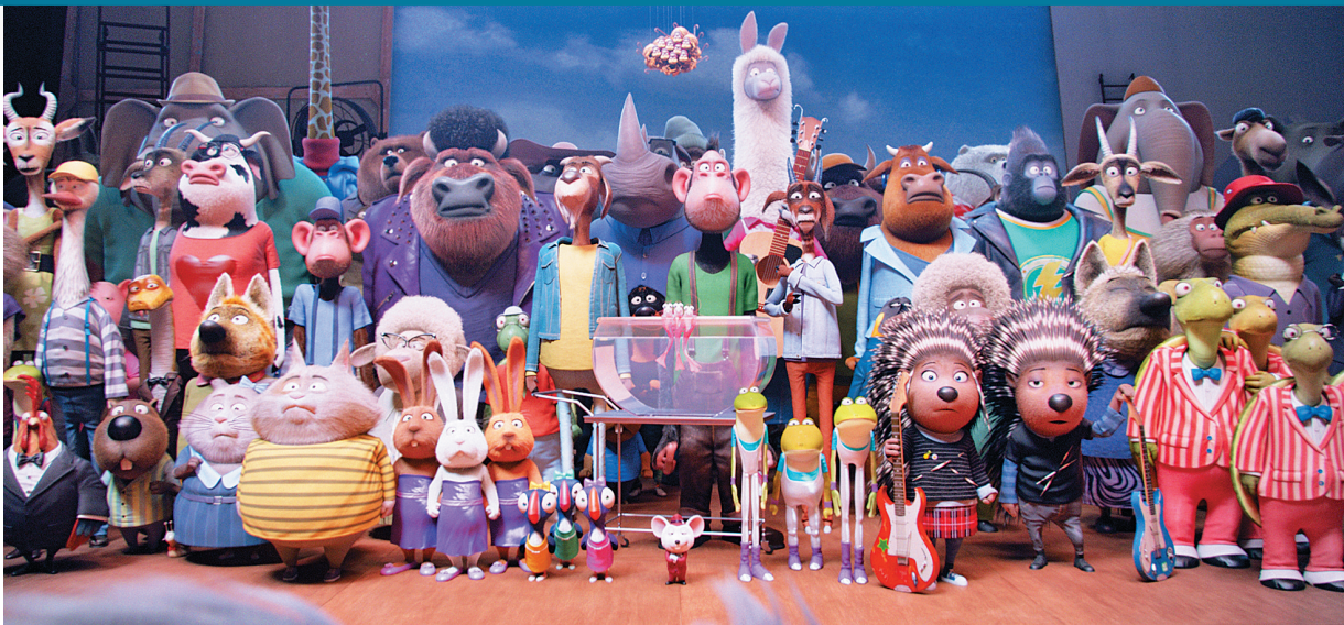
好莱坞动画大片《欢乐好声音》剧照