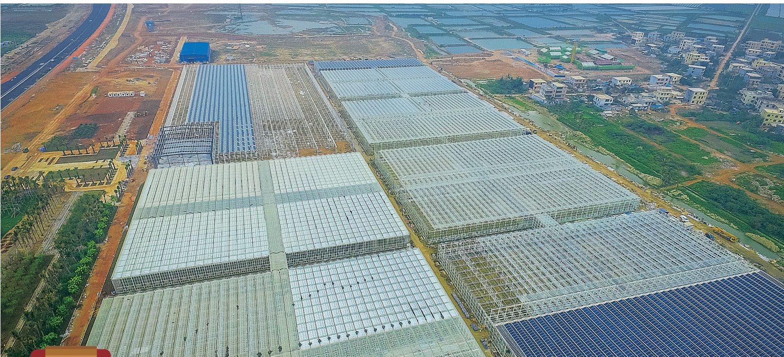
1月11日，鸟瞰桂林洋国家热带农业公园的农业梦工厂项目雏形。