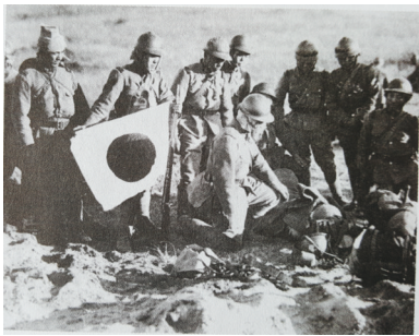
江桥抗战后的日军。