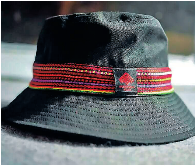
用黎锦图案点缀的渔夫帽。

如果说HipHop舞蹈是一种动态表达,服装设计何尝不是另一种静态表达?“服装设计是视觉上的,也是思想上的。”林尤杰说,他每卖出一件衣服,都会很享受这种被认可的感觉!而每一件穿在消费者身上的衣服,就意味着那是一次对海南黎族文化“流动的宣传”。