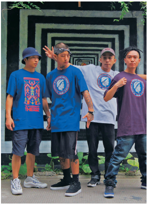
跳街舞的小伙身着黎族风的T恤。