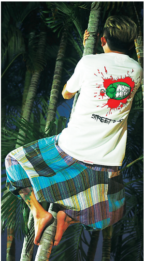
带有槟榔元素的T恤。