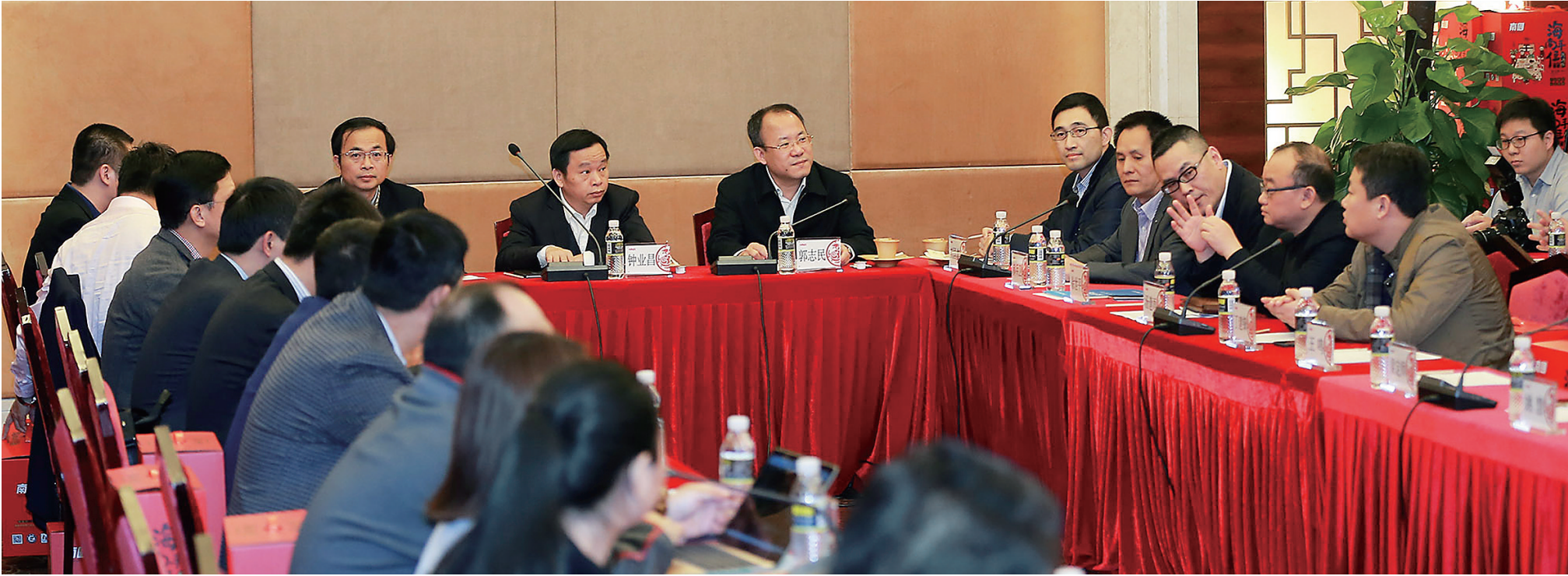
1月16日下午，首届全国“新三板”网媒高峰论坛在海口举行。

与会嘉宾还达成了《2017 首届全国挂牌新三板网媒高峰论坛海南共识》，高度认同行业合作协作对促进发展的积极作用，愿意进一步加强企业间的平等互利合作，愿意视彼此为优先合作对象，愿意在资本、版权、技术、经营等诸多方面开放资源优先共享，并为未来合作创造更多便利条件；愿意充分利用全国挂牌新三板网媒论坛等平台互鉴互学，整合资源，加强合作，实现共赢。条件成熟时，将组建全国挂牌新三板网媒联盟，成员轮流举办高峰论坛，将其打造成为行业内交流的重要平台。