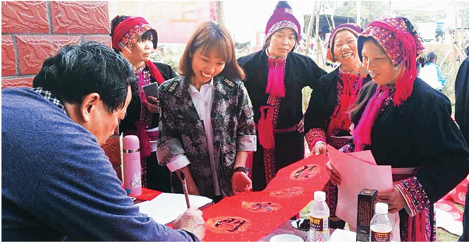
➔ 海报集团的书画家为青松乡村民现场书写春联。

在半天的活动中，海报集团的8名书画家在现场共书写了300余副春联，此外还将部分现场书写的春联送到了贫困户家中。不少贫困户表示，春联蕴含的美好祝愿，要等到除夕当天才亲手贴上，为新的一年添个好彩头。