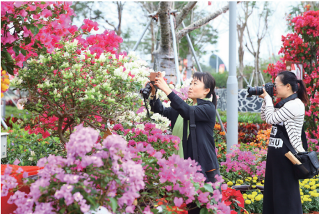
1月20日,在第二届海南国际旅游岛三角梅花展现场,鲜艳的三角梅吸引市民游客驻足观赏。

景观灯塔:响应“海上丝路”,象征希望的灯塔伫立在湖畔,照亮整个湖面,为一艘艘的三角梅花船领航,绚烂的灯光为整个花展增色添彩。