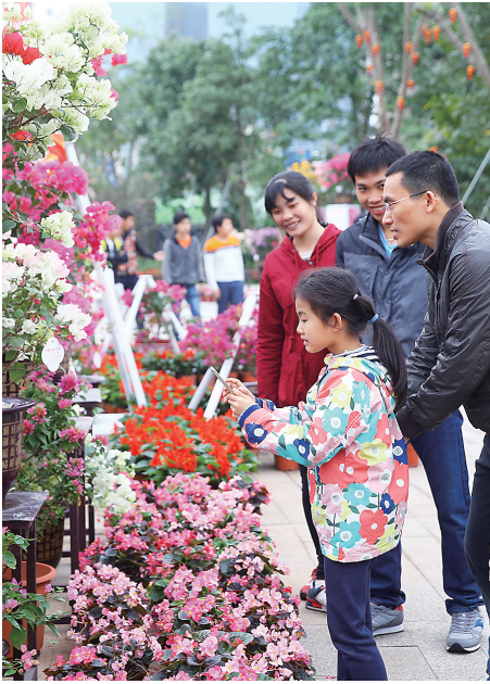
市民携家带口看花展。