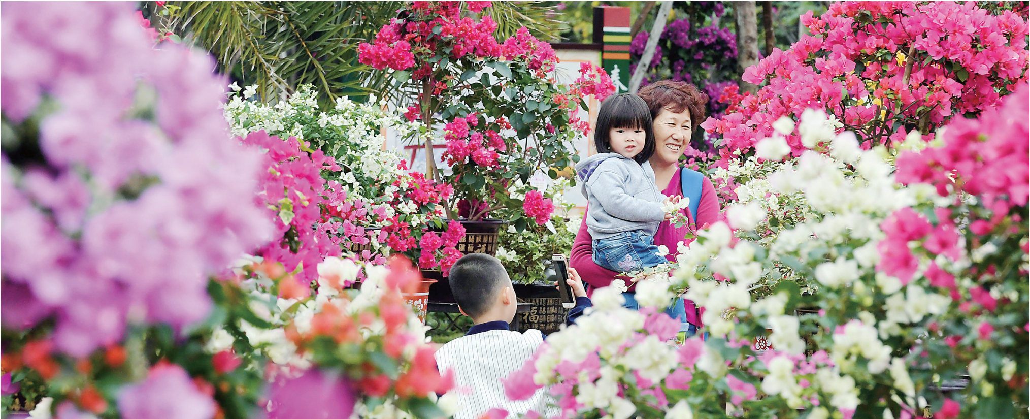
在滨海公园主展区内,花团锦簇,游人如织。

1月20日上午,主题为“新花城·新海口”的2017第二届海南国际旅游岛三角梅花展在日月广场举行了开幕仪式。在新春来临之际,随着三角梅花展的开幕,滨海公园、万绿园、世纪公园、日月广场等展区及海口的城市主干道与街区街巷被纷繁的花装扮一新,为冬季到来海口的游客呈现出一场色彩缤纷的三角梅盛宴,展示了海口“双创”成果、城市人居环境和人文风貌。本届三角梅花展由海口市政府主办,中国花卉协会盆景分会指导,海口市旅游发展委员会、市园林局、市城建集团、龙华区政府、省花卉协会共同承办,赏花及各主题活动将一直持续到4月15日,海口借助花展的开幕向岛内外游客发出了来海口旅游度假“过大年”的邀请。