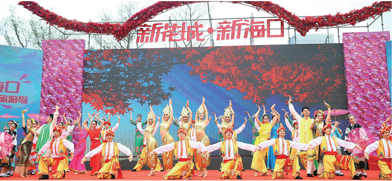
1月20日,2017第二届海南国际旅游岛三角梅花展在海口日月广场盛大开幕。